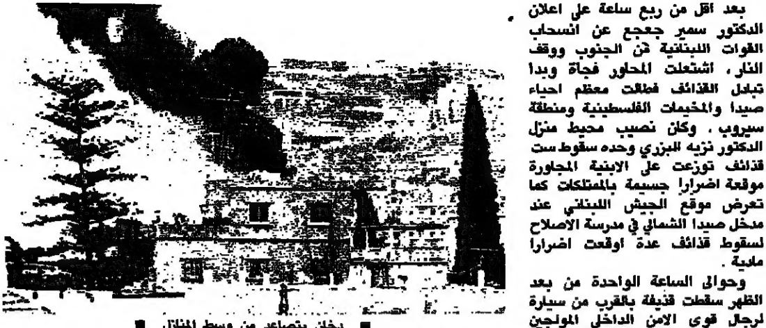
مخاض تصاعد من وسط المنزل

بعد أقل من ربع ساعة على اعلان الدكتور سمير جعجع عن انسحاب القوات اللبنانية من الجنوب ووقف النار، اشتعلت الحمول فجأة وبدأت تبتلع الأذائف فطقت معظم احياء صيدا والحيات الفلسطينية ومنطقة سرويوب. وكان نصب منزل الدكتور نزيه البيري وحده سقوطت قذائف تروعت في الابنية الجاورة موقعة اضراً جسيمة بالملصقات كما تعرض موقع الجيش اللبناني عند مدخل صيدا الشمالي في مدرسة الإصلاح لسقوط قذائف عدة اوقعت اضراً مالياً.